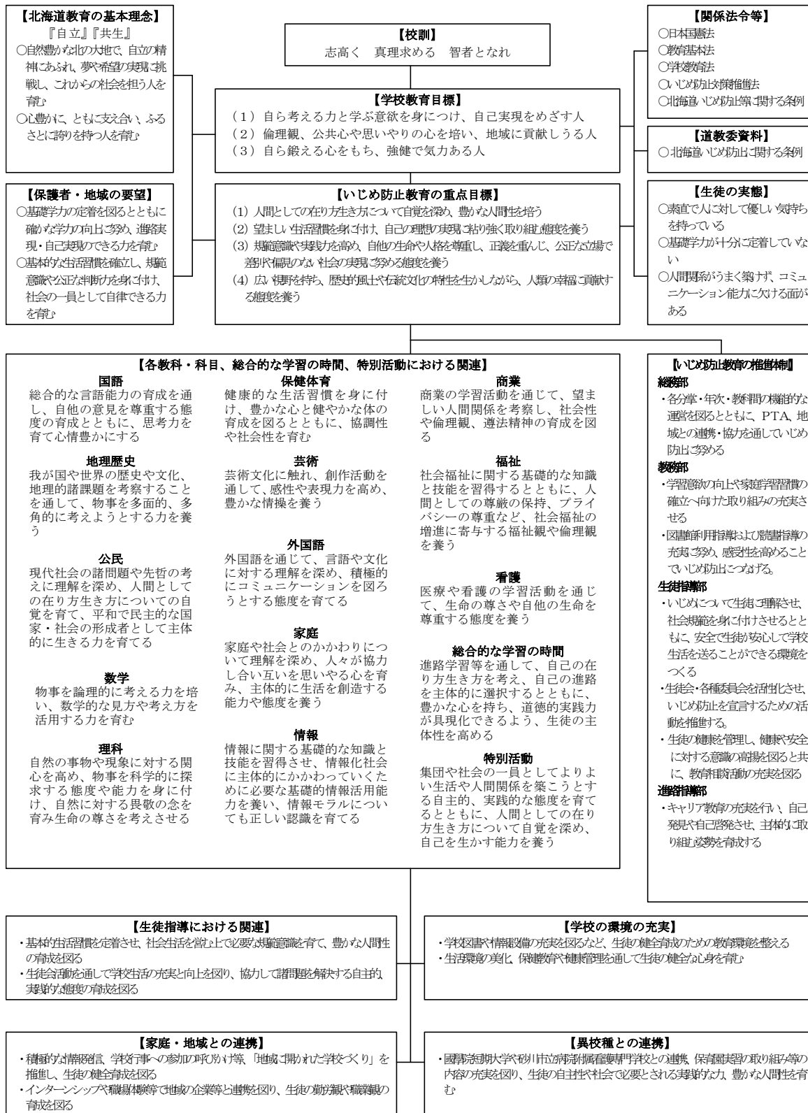
平成30年度いじめ防止教育の全体計画

全体計画については、学校の教育活動全般を通して、いじめについての指導がなされなければならない。そのため、学校全体でいじめの問題に取り組むことが大切である。